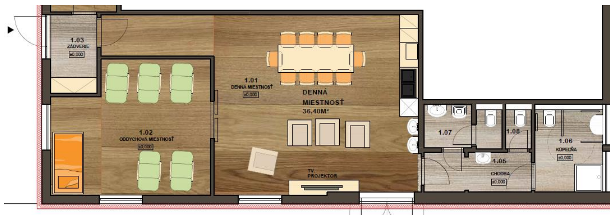
Obr. 1 Dispozičné riešenie Diakonického centra Cesta nádeje, Urbánkova č. 1 Košice