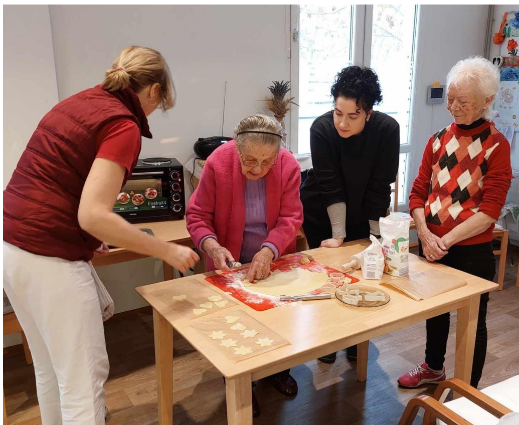
Obr. 5 Prvé vianočné pečenie