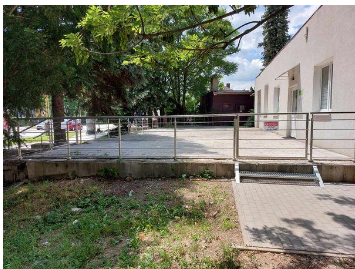
Obr. 6 Rekonštrukcia terasy a prístupový chodník

Tieto úpravy zlepšili dostupnosť a bezpečnosť našich služieb pre ľudí žijúcich s demenciou a ich opatrovateľov.