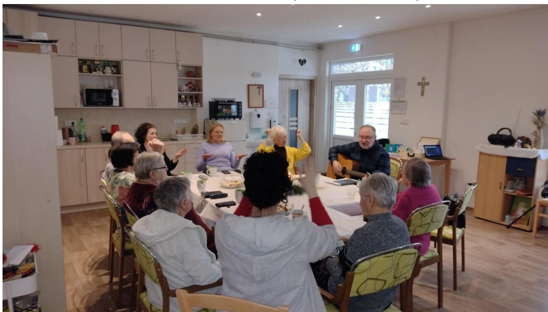
Obr. 2 Biblická hodina za účasti členov CZ ECAV Košice (adventné stretnutie)

Naši klienti sa tiež zúčastnili viacerých kultúrnych podujatí. Vo februári navštívili putovnú výstavu obrazov „Cesta môjho zotavenia“ vo verejnej knižnici. Podujatie pripravila organizácia ODOS a predstavené diela namaľovali ľudia žijúci s rôznymi psychiatrickými diagnózami. Klienti v sprievode personálu Diakonického centra sa tiež zúčastnili Dňa otvorených dverí v Botanickej záhrade UPJŠ v Košiciach a Výstavy fosílií a minerálov na Technickej univerzite v Košiciach.