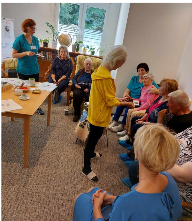
Obr. 7 Deň otvorených dverí

Prostredníctvom krátkej prednášky sa návštevníci mohli dozvedieť o dôležitosti sociálnej opory pre ich celkové zdravie a kvalitu života. Zapojením sa do aktivizácie a kognitívneho tréningu pre seniorov s témou „káva“ si precvičili svoju pamäť a zapojili všetky svoje zmysly (Obr. 7).