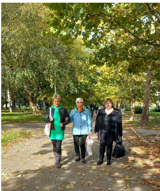
Obr. 1-2 Domáca opatrovateľská služba