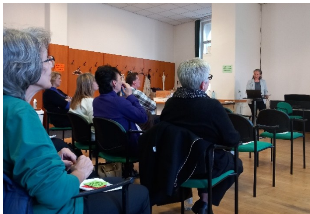
Obr. 22-24 Spoločné stretnutia pre klientov, ich rodinných a formálnych opatrovateľov

Vďaka finančnej podpore vo výške 3.000 € z Nadačného fondu Kaufland sme uskutočnili 35 osobných návštev v prirodzenom domácom prostredí klientov a dve spoločné stretnutia pre klientov, ich rodinných a formálnych opatrovateľov (Obr. 22-24), zapojené boli aj dve VŠ študentky - dobrovoľníčky. Pripravili sme tiež informačné a vzdelávacie materiály, ktoré ďalej využívame pri poskytovaní poradenstva a komunikácii.