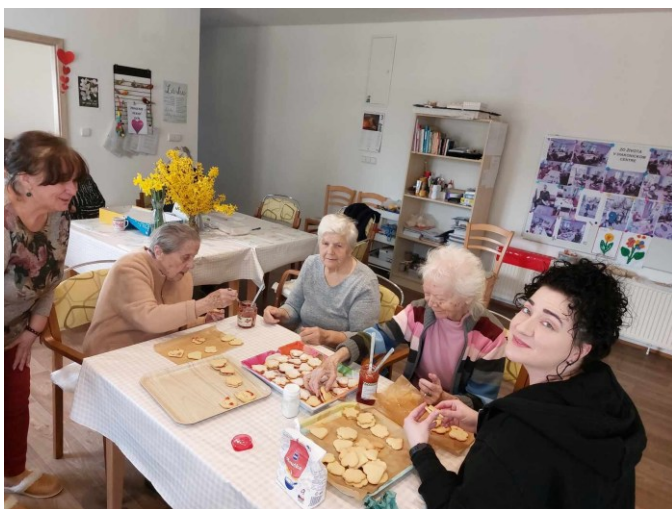
Obr. 4-5 Reminiscenčné pečenie

Prijímatelia sociálnych služieb sa v doprovode personálu zúčastnili Dňa otvorených dverí v Botanickej záhrade UPJŠ v Košiciach a pravidelne realizujú prechádzky v okolí Diakonického centra a neďalekého areálu Univerzity Veterinárneho lekárstva a farmácie v Košiciach. Zájmová činnosť a rozvoj pracovných zručností sa realizovali podľa individuálnych plánov klienta, najmä technikami s prvkami arteterapie, muzikoterapie, biblioterapie a gardenterapie. Rozvíjali sa zručnosti spojené s pečením (Obr. 4-5), tematicky zamerané na sviatky a ročné obdobia. Asistentka sociálnej práce zorganizovala mimoriadne aktivity, ako boli súťaž Zlatý slávik (Obr. 6-7), Športový deň a ďalšie pohybové aktivity v interiéri a exteriéri (Obr. 8-11), oslavy narodenín klientov (Obr. 12-13), rôzne tematicky orientované kvízy a kognitívne tréningy (Obr. 14-15).