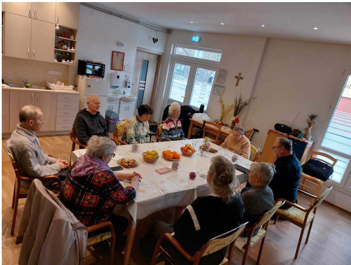
Obr. 3 Stretnutie v rámci biblickej hodiny

Na zabezpečení dennej prevádzky špecializovaného zariadenia sa podieľali: zodpovedná zástupkyňa pre špecializované zariadenie a súčasne sociálna pracovníčka, asistentka sociálnej práce a tri opatrovatelky. Odborní pracovníci špecializovaného zariadenia poskytovali základné sociálne poradenstvo, pomoc pri odkázanosti na pomoc inej fyzickej osoby, stravovanie a sociálnu rehabilitáciu pre udržanie fyzických síl a podporu nezávislosti prijímateľov sociálnej služby.